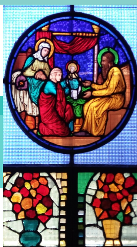
Vitrail église de la Nativité Nativité de la Vierge Marie